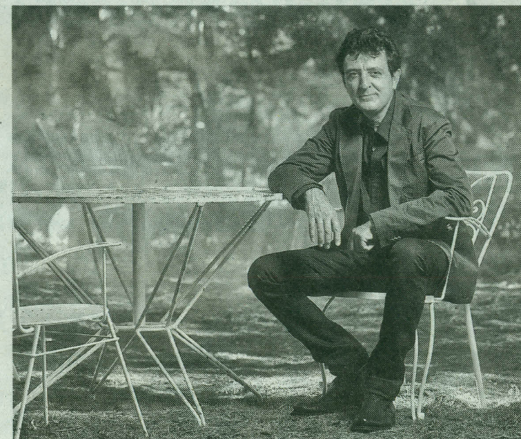
Manolo García actúa dentro de cuatro días en Huesca.

Las entradas están ya a la venta en la red Ticketmaster, que incluye todos los cajeros de La Caixa, Viajes Halcón (en Huesca, Binéfar, Fraga, Jaca y Sabiñánigo), Carrefour Viajes y Fnac, además de venta en web y telefónica.